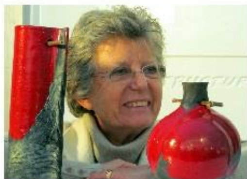
Edith Eyraud

Atelier POTERIE RAKU Comprenant 2 séances samedi 11 mai : 14h – 16 h (fabrication) et samedi 1 juin 15 h- 17 h (émaillage)