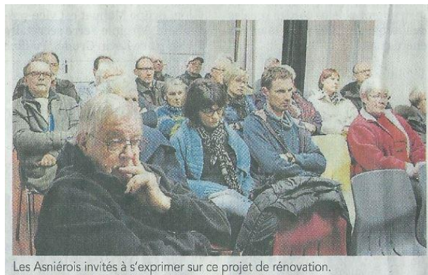
Les Asniérois invités à s'exprimer sur ce projet de rénovation.