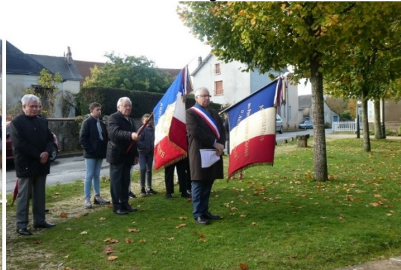
Le 11 Novembre , Commémoration au Monument aux Morts et Repas des anciens offert par la commune