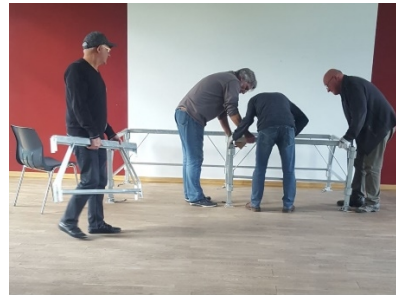
Le 5 Octobre , le Relais St Hilaire du Cercle du Vieux Pont rouvre pour la 6 è saison. Le 15 Octobre , Responsables d'Associations et bénévoles montent la scène de la Salle de la Marbrerie