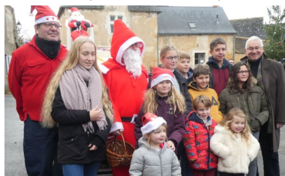
Le 15 Décembre , Arrivée du Père Noël