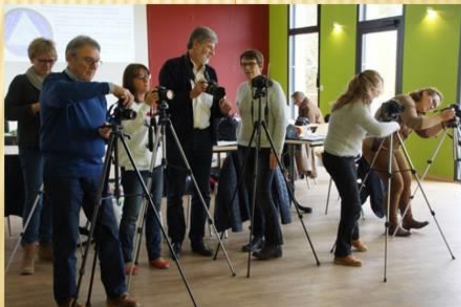
Atelier prise de vue en intérieur

NOTA: En fonction de l'avancement de la journée l'A2P72 pourra modifier ce programme