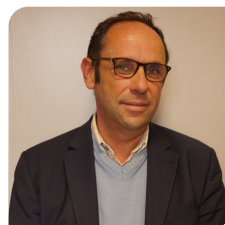
Antoine D'AMÉCOURT Maire d'Avoise Gestion des milieux aquatiques, Plan climat air énergie