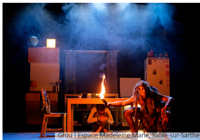
Grou ! Espace Madeleine Marie, Sablé-sur-Sarthe