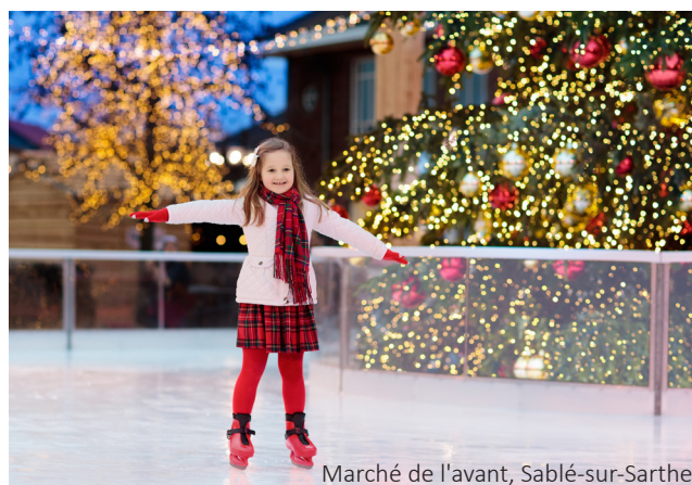
Marché de l'avant, Sablé-sur-Sarthe