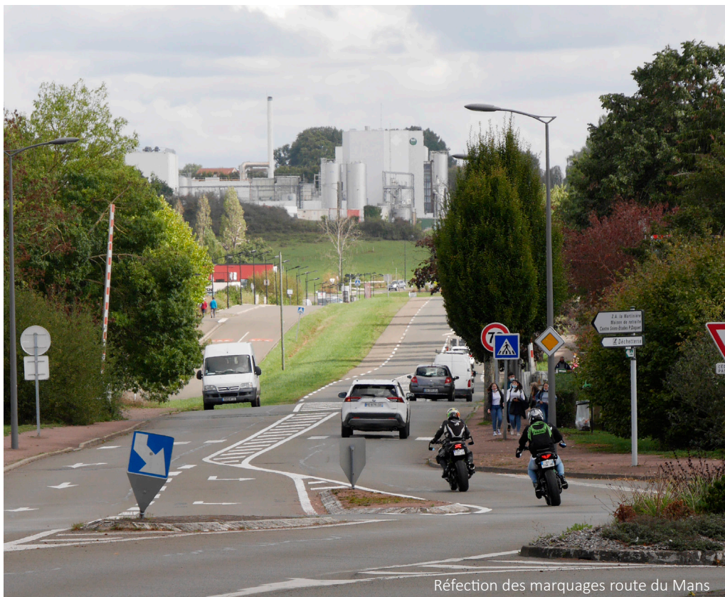
Réfection des marquages route du Mans