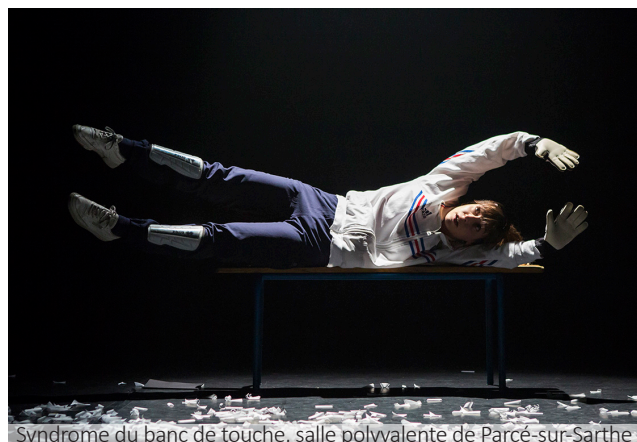
Syndrome du banc de touche, salle polyvalente de Parcé-sur-Sarthe