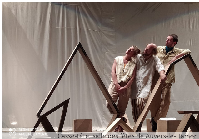
Casse-tête, salle des fêtes de Auvers-le-Hamon

Collectif protocole, performance itinérante, Médiathèque Intercommunale