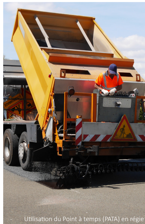
Utilisation du Point à temps (PATA) en régie

Trottoirs : Clos de la Fontaine 2 me partie