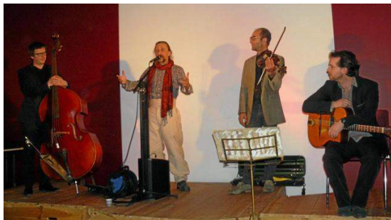
« Ouest France - 27/11/2017 »

Le 18 novembre dernier nous organisons notre Soirée Cabaret, qui, comme les précédentes a été très appréciée du public qui remplissait la salle de la Marbrerie. De très bons musiciens et chanteurs nous ont permis de découvrir ou redécouvrir des trésors de la chanson française. Tantôt sur le mode satirique, tantôt dans la poésie ou l'humour, ces 4 compères de La Rallonge ont emballé l'auditoire.